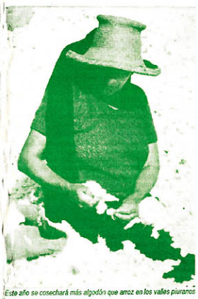
Este año se cosechará más algodón que arroz en los valles piuranos