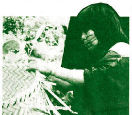
Las poblaciones nativas sin filiación serán las primeras afectadas con la Ley de Bases de la Amazonía