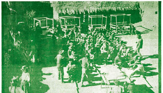
El Instituto Nacional de Comunidades Campesinas continúa siendo un organismo desconocido para las comunidades campesinas.

Resultado pues más que evidente la falta de interés de parte del gobierno sobre la existencia y funcionamiento de un organismo sin recursos materiales y humanos para dar respuesta a gran desafío que plantea el desarrollo integral de las comunidades campesinas y nativas. Lejos quedan los discursos que declaraban a las comunidades la esencia viva de la nacionalidad peruana.