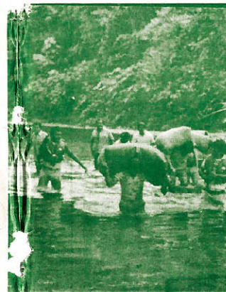
Más de 300 manuales utilizados para la erradicación de los cultivos de coca grandes son sustituidos por sustancias químicas.