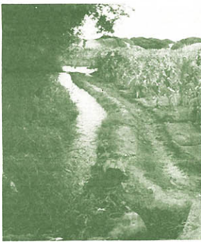
"Esfuerzos y condiciones abundan en el agro".

Para enfrentar esta situación deben combinarse dos alternativas. Por un lado, el Perú debe aumentar sus exportaciones agropecuarias de modo que las divisas generadas contribuyan a reducir el profundo déficit de nuestra balanza comercial. Del otro, es necesario aumentar la producción interna agropecuaria, para disminuir las importaciones de alimentos.