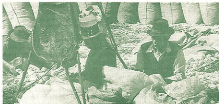
Los países del Pacto Andino buscan un régimen de protección arancelaria común.

Ante estos acuerdos, corresponde poner en discusión el sistema de sobretasas arancelarias que se viene aplicando en el país. El debate debe ser abierto en el mismo CCD, donde sigue pendiente el proyecto de ley aprobado hace un año y no promulgado debido a la observación del Presidente Fujimori.