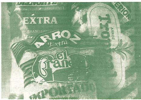
El título de propiedad es para el pequeño agricultor instrumento de defensa de sus tierras.

carse la razón por la cual hubo y hay empresas, como "Apoyo Agroindustrial SA", que continúan trayendo arces importados cuando, en medio del aumento de la producción nacional, los precios internos se vinieron abajo. Y es que, contrariamente a lo que se pensaba, esos arces importados resultaban aún más baratos que los nacionales precisamente por ingresar al país liberados de los derechos aduaneros.