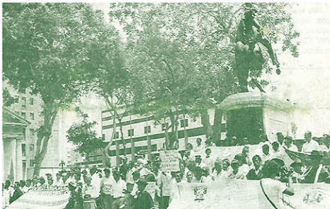
En movilización realizada a mediados de abril, dirigentes comuneros llegaron hasta el Congreso