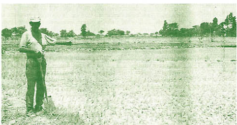
Arroz seco en Ferrehoje

A diferencia del valle de San Lorenzo donde la crítica situación del reservorio impedirá realizar una segunda campaña, en el Chira y el Bajo y Medio Piura la situación mejoró ligeramente con las sorpresas de lluvias del mes de abril que permitieron reponer el nivel de almacenamiento del reservorio Pochos. Las aguas, sin embargo, se encuentran por debajo del nivel histórico, por lo que la Dirección Regional Agraria