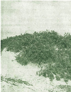
Eriazos noteros podrán ser denunciados por iniciativa privada.

La resolución plantea un procedimiento que no es tan nuevo pues recuerda normas ya derogadas sobre la adjudicación de eriazos a los particulares. Según lo establecido, la iniciativa la tienen los interesados en adquirir determinadas tierras eriazas, quienes deberán dirigirse al PETT solicitando la verificación de que las áreas de su interés son de libre disponibilidad. Cumplido el trámite, el PETT publicará la solicitud del interesado para que quienes se consideren afectados puedan presentar oposición en un plazo de quince días. Si no se presentan oposiciones o éstas son desestimadas por el organismo estatal, se autorizará mediante Resolución Suprema del Ministerio de Agricultura la inscripción registral de las tierras eriazas a nombre del Estado para su posterior transferencia a la COPRI, la que entonces procederá a su venta o entrega en concesión.