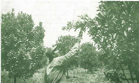
La asistencia técnica, una de las urgencias planteadas por El Niño.

Pero también hay que llamar la atención que los daños y pérdidas se concentran hasta el momento junto con Tumbes, en regiones y lugares, como Oxapampa en Pasco, Castrovirreyna en Huancavelica, la sierra de Huaura al norte de Lima, donde las acciones de prevención fueron mínimas, por no de cir más.