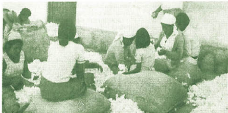
El algodón, uno de los productos que se podrá negociar en la Bolsa.

En los folletos que está difundiendo la Bolsa de Productos de Lima, señala, que también prestará servicios de apoyo al desarrollo de asociaciones entre productores, comerciantes e industriales. Los algodoneros, maticeros, arroceros o cafetaleros interesados pueden solicitar mayor información en el local de la Bolsa, Jirón Junín 270, Lima.