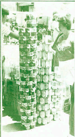
El porcentaje de componente nacional de la leche evaporada se ha reducido en los últimos años.

En esta constante reducción del componente nacional en la producción de leche evaporada, se encuentra también una de las explicaciones del espectacular crecimiento de las importaciones en este rubro (ver cuadro).