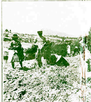
Para el ministro Coronado la sobrevivencia del agro supone, lo...

- Mire, las mismas medidas pueden ser buenas en unas circunstancias y malas en otra, hay una relatividad en esta. Cuando el Presidente García definió esta política del Tráfico Andino y dijo: tasa cero, tuvo un fundamento filosófico, histórico. Pero no estamos para estudios, en ese momento, la habilidad política del gobernante permite ver ciertas necesidades que si no se hicieran serían fantasmagóricas muy difíciles. Esto tuvo su efecto, un efecto psicológico. ¿Qué es lo que se refiere a la masa monetaria del BAP?, insignificante; ¿cómo se ha comportado el retorno?, no lo completo que podría haber sido, pero mejor de lo esperado; ¿qué ha sucedido mientras tanto?, mal uso del dinero, tasa cero, dinero para producir que se convierte en dinero comercial donde es más fácil recibir intereses que sembrar la tierra. Ese comportamiento no se ha dado en grado significativo, pero aunque así hubiera sido, es dinero que ingresa a esas economías y bien sea a través de la siembra o de la intensificación del comercio hace su efecto dentro de esta situación, luego de más de dos años está el análisis del resultado. Las medidas que ahora está tomando el Banco Agrario son consecuencia del análisis de resultados.