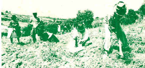
La reducción de las áreas sembradas y la falta de crédito y fertilizantes hacen prever que el próximo año habrá una drástica disminución de la producción agropecuaria.

Hay que hacer la salvedad que en el caso de algunos cultivos, como el maíz amarillo duro, las reducciones en la producción serán mayores a las previstas, debido a las significativas disminuciones que se vienen operando en las áreas sembradas. Las previsiones señalan que en el próximo año las dificultades para el abastecimiento de productos de primera necesidad serán mayores que las surgidas en la actualidad, sin que existan posibilidades de suplir el desabastecimiento con la importación, dada la escasez de divisas. Esto en la práctica de los consumidores significará mayores colas, sobrepesos y pérdida de tiempo para poder agenciarse de los productos básicos.